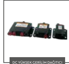
DC YÜKSEK GERİLİM DAĞITICI