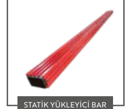
STATİK YÜKLEYİCİ BAR