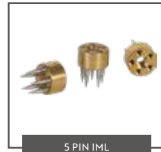
5 PIN IML