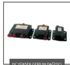
DC YÜKSEK GERİLİM DAĞITICI