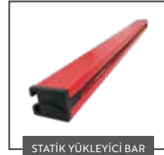
STATİK YÜKLEYİCİ BAR