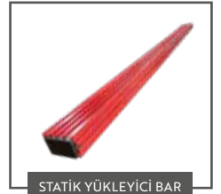
STATİK YÜKLEYİCİ BAR